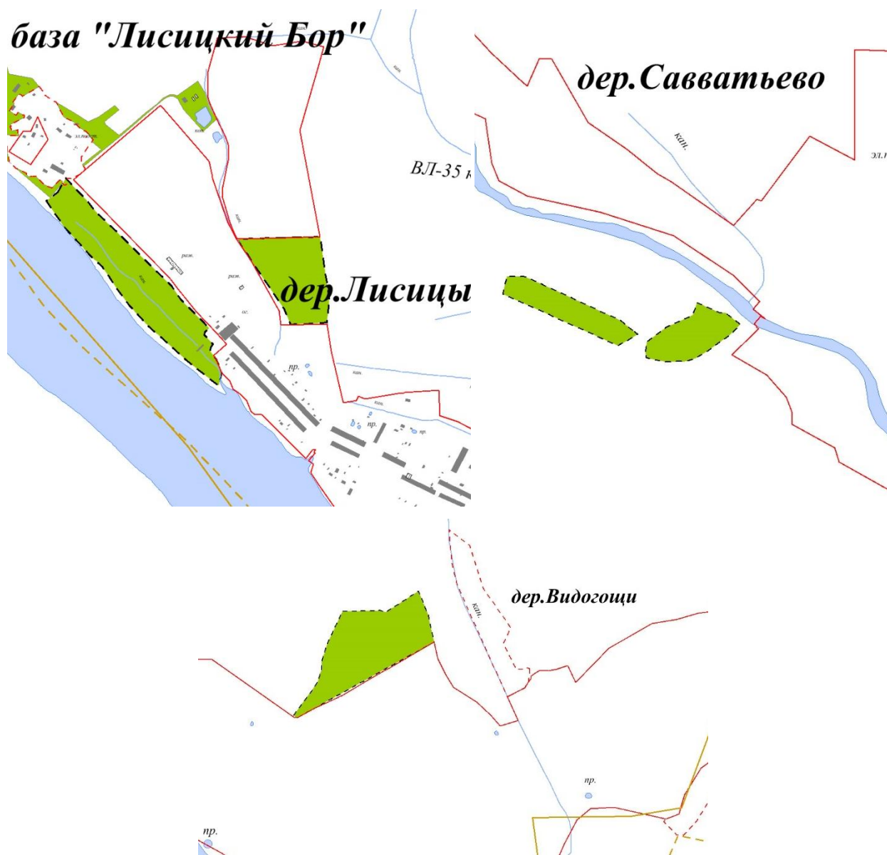
Рис. 4. Схема расположения земельных участков, планируемых к переводу в земли особо охраняемых территорий и объектов