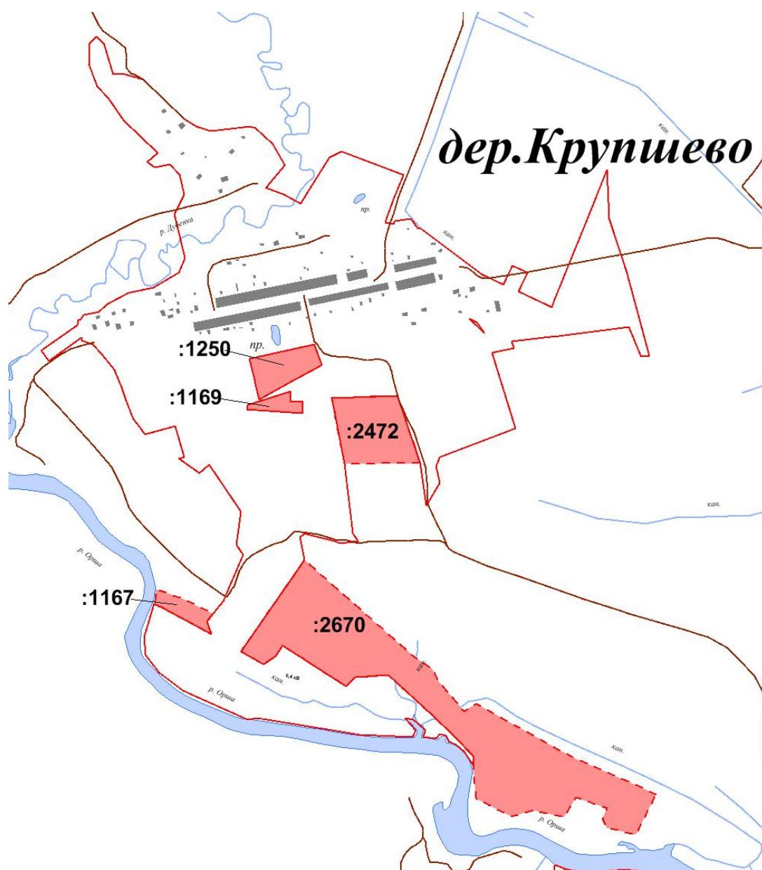
Рис. 2. Схема расположения земельных участков, планируемых к включению в границу д. Крупшево

Расширение границы населенного пункта осуществляется за счет земельных участков из земель сельскохозяйственного назначения с кадастровыми номерами 69:10:0000018:2670, 69:10:0000018:2472, 69:10:0000018:1169, 69:10:0000018:1167, 69:10:0000018:1250.