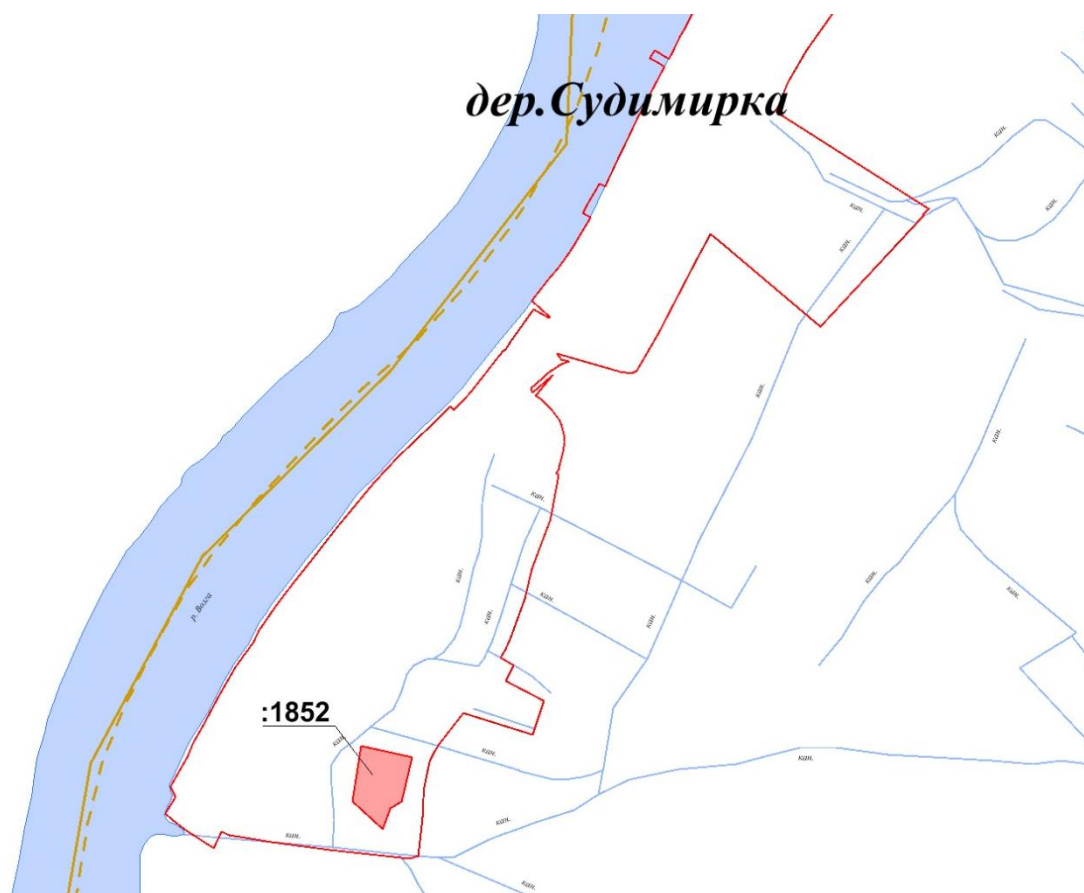
Рис. 1. Схема расположения земельных участков, планируемых к включению в границу д. Судимирка

Расширение границы населенного пункта осуществляется за счет земельных участков из земель сельскохозяйственного назначения с кадастровыми номерами 69:10:0000018:1852.