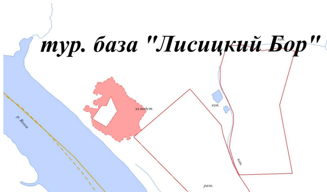
Рис. 3. Схема расположения проектных границ т.б. Лисицкий Бор

Функциональная зона – жилая – увеличивается на 5,16 га. На указанной территории располагаются жилые дома и земельные участки, имеющие категорию «земли населенных пунктов».