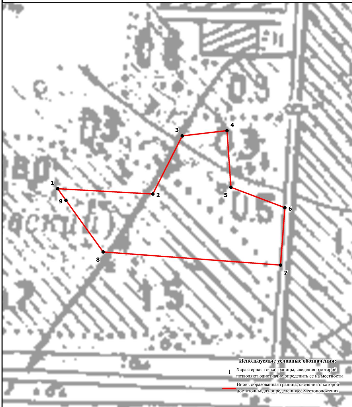
План границ объекта