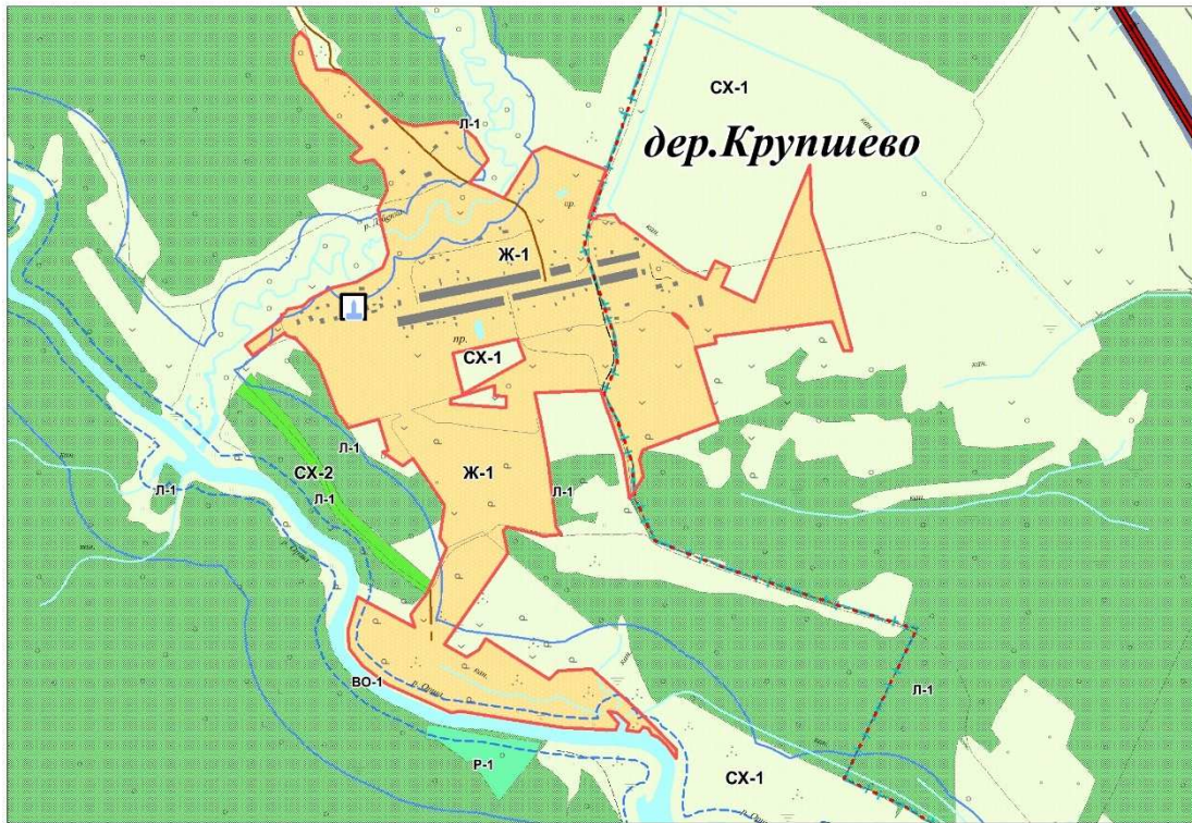
Рис.3 Границы территориальных зон д. Крупшево после внесения изменений.