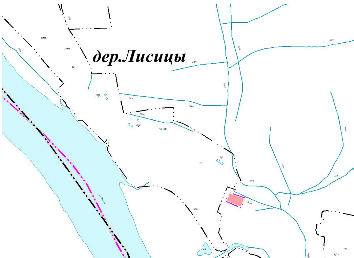
Рисунок 1 – Схема расположения земельных участков, планируемых к включению в границу д. Лисицы

Расширение границы населенного пункта осуществляется за счет земельных участков из земель сельскохозяйственного назначения общей площадью 0,7 га.